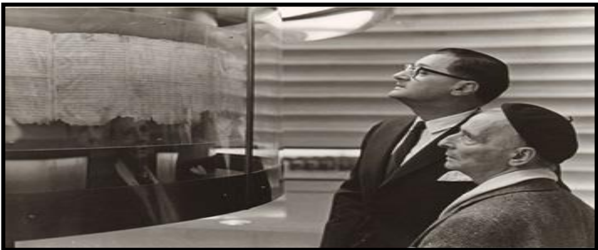
Frederick Kiesler and Armand Bartos in Jerusalem, 1965. " Dos personas asombradas en el Museo del Libro en Jerusalén observando el Rollo del Profeta Isaías".

7 En lugar de vuestra doble confusión y de vuestra deshonra, os alabarán en sus heredades; por lo cual en sus tierras poseerán doble honra, y tendrán perpetuo gozo.