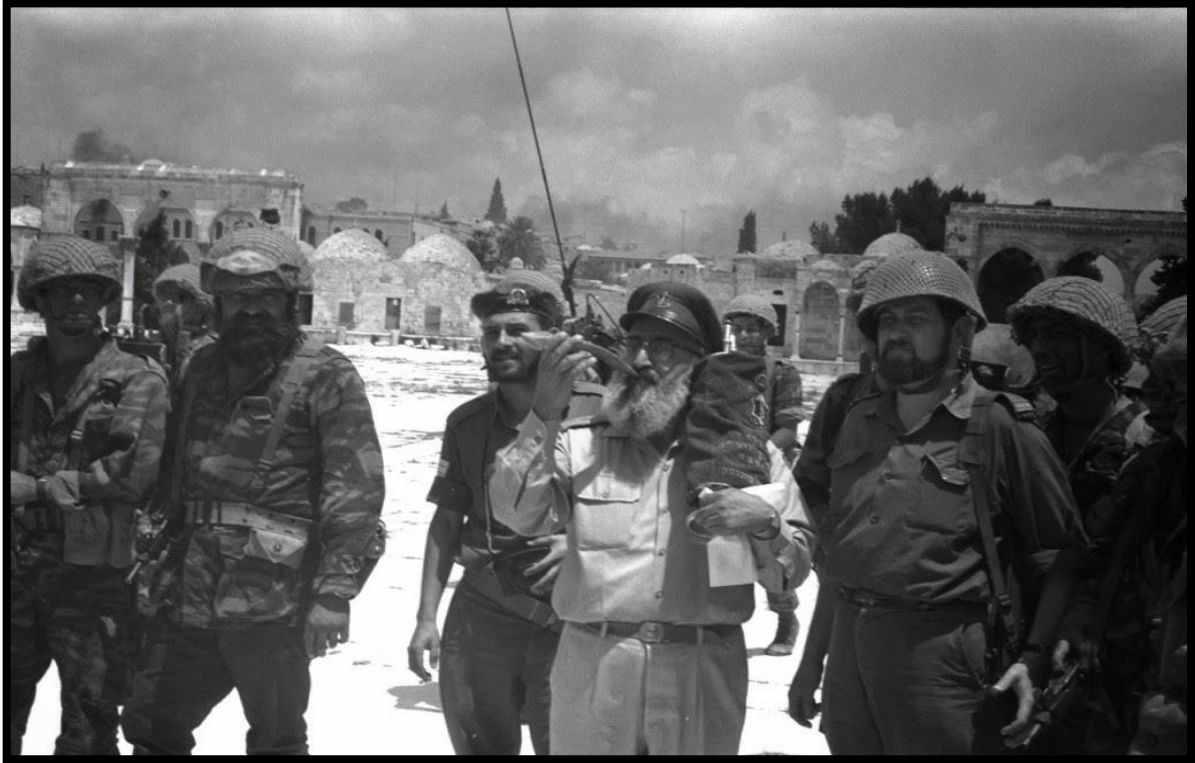
Foto 1. “ 7 de Junio de 1967, Jerusalén regresa a manos de los judíos, el Rabino Goren, tocando el Shofar, en Kotel, el sonido del shofar, sonando luego de 2000 años en La Ciudad de David.